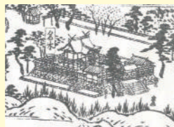
「撰津名所図会」本殿部分

瑞垣の正門として安永4年(1775年)に瓦葺で建立され、天保年間頃に柿葺(こけらぶぎ)に屋根替されました。『撰津名所図会』にみえる本殿前方の瑞垣中央の門がこの唐門であり、明治13年の拜殿建設の際、現在地に移されました。唐門屋根に見える美しい輪垂木(わだるぎ)の曲線は、本殿屋根の唐破風(からはふう)のものと類似しており、先進技術を取り入れようとする当時の氏子の方々の厚い思いを感じることが出来ます。現在ご覧いただける屋根の銅板は、柿板