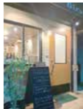
「tsutsumu」の焼き餃子 5コ入290円～その他多数

す。店長曰く「提供している餃子は野菜本来の甘みを活かしてヘルシーに作っています。」とのこと。ふらっと仕事終わりに、休日のディナーに、ぜひ一度こだわりの餃子を味わってみて。