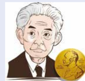
茨木が生んだノーベル文学賞作家 川端康成の傑作が原案

もない、不思議なお通夜を通して、失った友情を取り戻し、果たせなかった愛の思いをあらたにする仲間たち。そして、笑いと涙の一夜に、思わぬファンタジックな朝がやってくる。大切な人の死によって、再び結びつく仲間の絆。観る人すべてのノスタルジーを揺さぶる、大人の物語が誕生した。