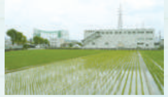
人面付土器は発送センター建設のとき田んぼの中から見つかったとか

今号の「知ってますかシリーズ」でも紹介していますが、実はこの遺跡にも人面の土偶頭部が見つっています。頭がモチカン状でピアスの穴もあり立体的です。人面土器の目垣遺跡と人面土偶の東奈良遺跡とは2.5kmしか離れていませんが、これは全国的に珍しいことなんです。