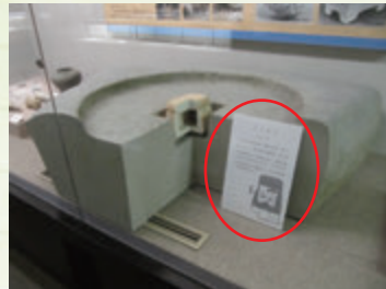
茨木市文化財資料館の物はレプリカで、本物は東京国立博物館で保管されています

飛鳥末期から奈良時代の寺院遺構、中臣太田連の氏寺と思われます。塔婆心礎の中に石の櫃があり、さらにその中に銅銀金(大中小)の三つの容器が収まり、さらにその中に仏舎利と思われる石があったとか。でも容器を開けた途端、下の泥の中に落ちて、いくら探しても見つからなかったと云われています。明治40年の話しです。