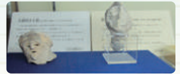
左が目垣遺跡のもの、右は東奈良遺跡のモチカン状土偶そして、両方とも茨木市指定文化財です

1973(昭和48)年、電力会社の鉄塔建設工事で弥生時代の遺跡が発見されました。平成9年から再調査された際、人面付土器(7cm×4cm)が見つかりました。顔だけで首から下は欠損して全体像は解りません。耳にピアス用の穴もあります。