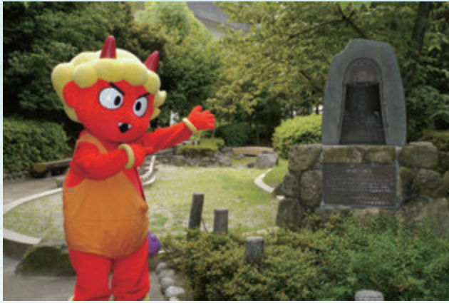
文化財資料館の裏にはこんなスペースがありますよ

茨木には貴重な遺跡が一杯あるけど、ちょっと興味ある遺跡を紹介するね。発見のエピソードが面白いんだよ！