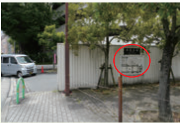
いつも行くスーパーの駐車場の入口横で～す

1985(昭和60)年にショッピングセンター予定地に弥生時代の水路が発見、丸太を打ち込み板材を斜めに打った井堰跡や粘土上に足跡状の凹みもあり、水田井堰と云われています。ショッピングセンターの北東部に説明板があります。