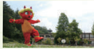
北辰中学校は廃校になったけど、隣の旧春日丘高校分校跡は里山センターになったので、行った時は思い出してね！

1971(昭和46)年、北辰中学校のグラウンドで女子生徒が奇妙な形の石器を見つけました。ハート型のような矢じりが溶けた丸味を帯びた考古学では「とろけている」と表現する石器なのでトロトロ石器と呼ばれています。大きさは3.6cmの打製石器です。