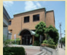
茨木市立文化財資料館