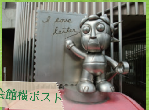
茨木市福祉文化会館横ポスト

ポストの上にちょこんと乗っている、メタリックなボク!市政50周年を記念して設置されたんだ!! 我ながら、強そうでかっこいい~?!