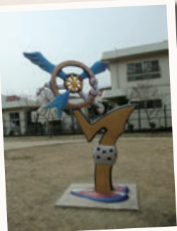
「共生 / GOLD CIRCLE」 中西 學 (東中条東公園)