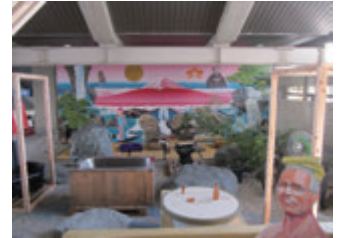
NN.P.O × 市民会館 (茨木市駅前四丁目 7-50)