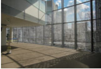
中島 麦 × 生涯学習センターきらめき (茨木市畑田町 1-43)