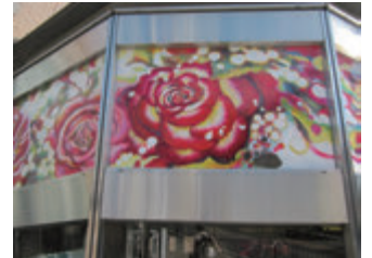
藤本 絢子 × 男女共生センターローズ WAM (茨木市元町 4-7)