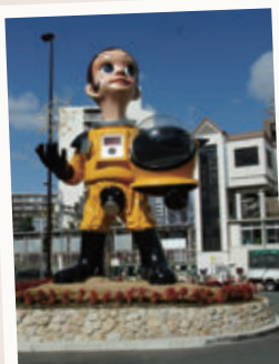
「サン・チャイルド」 ヤノバケンジ (阪急南茨木駅前ロータリー内)