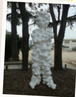
「Trans-Ren (Bump,White)」 名和 晃平 (東中条東公園前の元茨木川緑地)

茨木市内には元茨木川緑地彫刻設置事業で設置された彫刻作品などパブリックアートがたくさん！