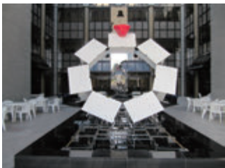
山城 優摩 × 市民総合センター (茨木市駅前四丁目 6-16)