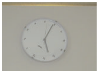
小宮 太郎 × 市民体育館 (茨木市小川町 2-1)