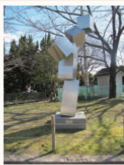
「変様-空へ」 林 宰久 (茨木税務署向かいの元茨木川緑地)